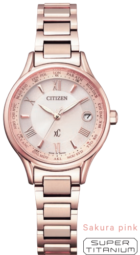
Sakura pink SUPER TITANIUM