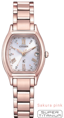
Sakura pink SUPER TITANIUM