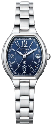
ES9360-58L ¥64,900 (税抜価格¥59,000)