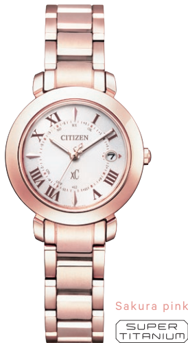
Sakura pink SUPER TITANIUM