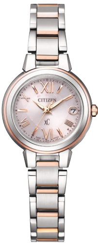
ES9434-53W ¥55,000 (税抜価格¥50,000)