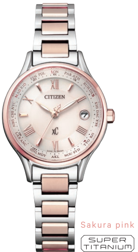
Sakura pink SUPER TITANIUM