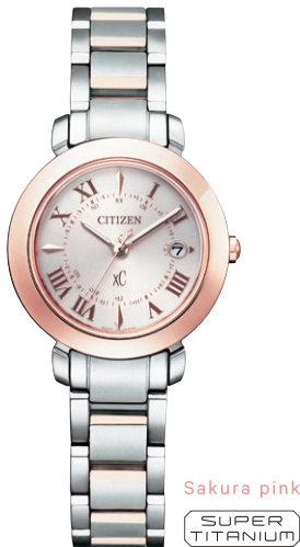
Sakura pink SUPER TITANIUM