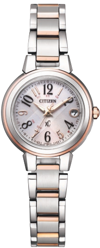
ES9434-53X ¥55,000 (税抜価格¥50,000)