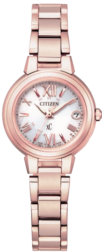
ES9435-51A ¥55,000 (税抜価格¥50,000)