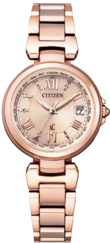
EC1032-54X ¥63,800 (税抜価格¥58,000)