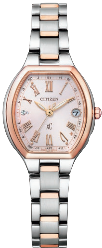
NEW ES9364-57W ¥64,900 (税抜価格¥59,000)