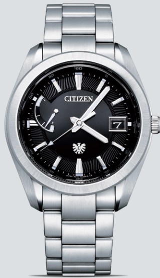
NEW AQ1050-50F ¥374,000 (税抜価格 ¥340,000) ステンレス (デュラテクトプラチナ)