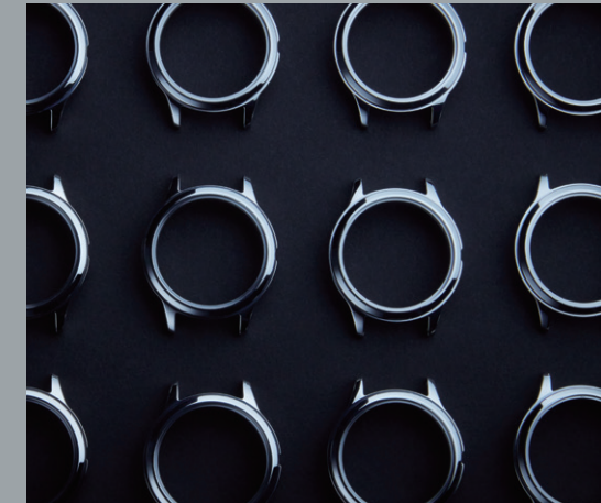
Core Technology 03 | Duratect

「キズに強い」「軽い」「肌にやさしい」「サビにくい」、そんな腕時計にとって理想的な特性を持つシチズンの独自素材スーパーチタニウム™。長きにわたり磨いてきたチタニウム加工技術と表面硬化技術（デュラテクト）によってチタニウムを進化させ、ステンレスの5倍以上の硬さと美しさを実現しています。