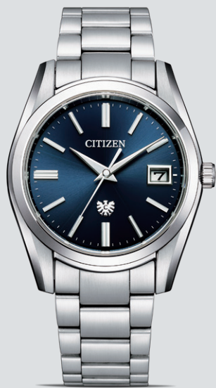
NEW AQ4080-52L ¥286,000 (税抜価格 ¥260,000) ステンレス(デュラテクトプラチナ)