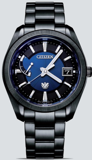
NEW AQ1054-59L ¥407,000 (税抜価格 ¥370,000) ステンレス (デュラテクト DLC) 限定250本

世界初の年差±5秒「エコ・ドライブ」 に搭載されたCaliber A010。その 誕生10周年を記念するモデルが登場。 時を経ても、新たな進化と感動を。 シャープなエッジパターンが際立つ ダイヤルは、その意志の象徴。