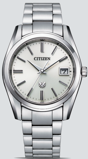
NEW AQ4080-52A ¥286,000 (税抜価格 ¥260,000) ステンレス(デュラテクトプラチナ)