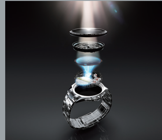
Core Technology 01 | Eco-Drive

次なる理想に挑む The CITIZENを支える シチズンの コアテクノロジー。