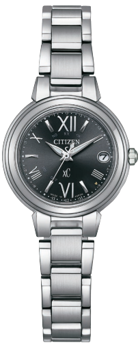
NEW 8月発売予定 ES9430-89E ¥60,500 (税抜価格¥55,000)

Cal. H060 ケース:ステンレス めっき(ジェットブラック色) 厚み:7.2mm／横幅:25.0mm ガラス:サファイアガラス(無反射コーティング) 防水性能:10気圧防水 耐磁1種／夜光