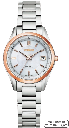
ES9374-53A ¥121,000 (税抜価格¥110,000)