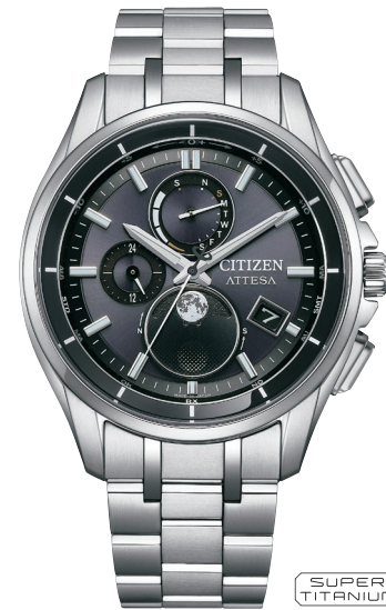
NEW 7月発売予定 BY1001-66E ¥137,500 (税抜価格¥125,000)

Cal. H874 ケース:スーパーチタニウム デュラテクトDLC(ブラック色) 厚み:10.8mm/横幅:41.5mm ガラス:サファイアガラス(無反射コーティング) 防水性能:10気圧防水 耐メタル/耐磁1種/夜光 フィットアジャスター ムーンフェイズ機能