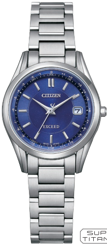
NEW 7月発売予定 ES9370-62L ¥121,000 (税抜価格¥110,000)

Cal. H149 ケース:スーパーチタニウム デュラテクトブラチナ(ライトシルバー色) 厚み:8.5mm/横幅:38.0mm ガラス:サファイアガラス (クラリティ・コーティング) 防水性能:5気圧防水 耐ニッケル/耐磁1種