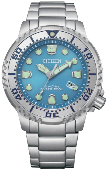
NEW 6月発売 BN0165-55L ¥49,500 (税抜価格¥45,000)

Cal. E168 ケース:ステンレス 厚み:11.5mm／横幅:44.0mm ガラス:クリスタルガラス 防水性能:200m潜水用防水 ISO 耐磁1種／夜光 逆回転防止ベゼル／ねじロックりゅうず ラチェット付ダブルホールディングバックル