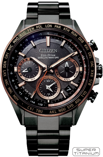
CC4016-67E ¥297,000 (税抜価格¥270,000)