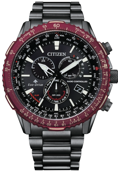
CB5009-55E ¥88,000 (税抜価格¥80,000)