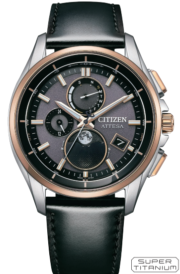
NEW 7月発売予定 BY1004-17X ¥126,500 (税抜価格¥115,000)

Cal. H874 ケース:スーパーチタニウム デュラテクトチタンカーバイト(シルバー色) 厚み:10.8mm/横幅:41.5mm ガラス:サファイアガラス(無反射コーティング) 防水性能:10気圧防水 耐メタル/耐磁1種/夜光 フィットアジャスター ムーンフェイズ機能