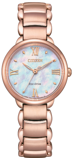
NEW 7月発売予定 EM0928-84D ¥37,400 (税抜価格¥34,000)

Cal. E031 ケース:ステンレス 厚み:8.0mm／横幅:28.0mm ガラス:球面サファイアガラス 防水性能:5気圧防水 白蝶貝文字板