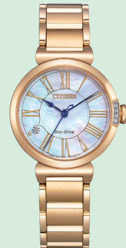
EM1063-89D ¥56,100 (税抜価格¥51,000)

ケース:ステンレス 厚み:8.3mm/横幅:29.5mm ガラス:球面サファイアガラス 防水性能:5気圧防水 白蝶貝文字板 文字板部品:一部再生素材 文字板:1ポイントダイヤ入 ケース:4ポイントダイヤ入 りゅうず:ガラスセラミックス (ブルー色)入