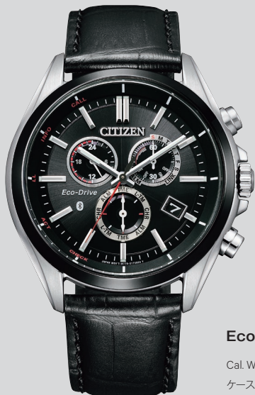
BZ1054-04E ¥63,800 (税抜価格¥58,000)