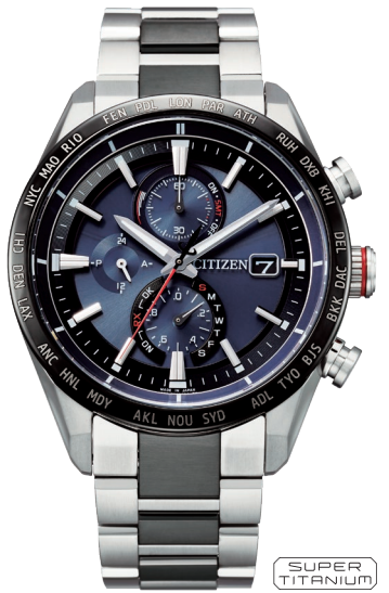
AT8186-51L ¥143,000 (税抜価格¥130,000)

Cal. H800 ケース:スーパーチタニウム デュラテクトDLC(ブラック色) 厚み:10.8mm/横幅:42.0mm ガラス:サファイアガラス (クラリティ・コーティング) 防水性能:10気圧防水 耐メタル/耐磁1種/夜光 フィットアジャスター