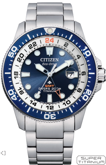
BJ7111-86L ¥72,600 (税抜価格¥66,000)

Cal. B877 ケース:スーパーチタニウム デュラテクトチタンカーバイド[一部除く] (シルバー色) 厚み:13.8mm／横幅:43.0mm ガラス:サファイアガラス 防水性能:200m潜水用防水 ISO 耐ニッケル／耐磁1種／夜光 逆回転防止ベゼル／ねじロックりゅうず