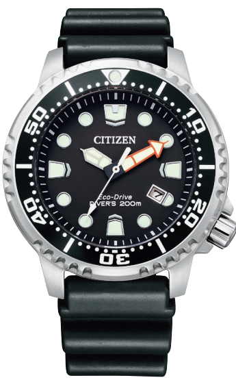
BN0156-05E ¥45,100 (税抜価格¥41,000)

Cal. E168 ケース:ステンレス 厚み:11.5mm／横幅:44.0mm ガラス:クリスタルガラス 防水性能:200m潜水用防水 ISO 耐磁1種／夜光 逆回転防止ベゼル／ねじロックりゅうず ラチェット付ダブルホールディングバックル