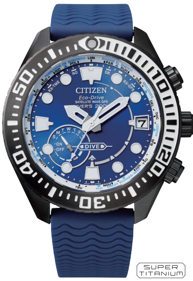
CC5006-06L ¥181,500 (税抜価格¥165,000)

Cal. E168 ケース:ステンレス めっき(ジェットブラック色) 厚み:14.6mm／横幅:46.0mm ガラス:球面クリスタルガラス 防水性能:200m潜水用防水 ISO 耐磁1種／夜光 逆回転防止ベゼル／ねじロックリゅうず ウレタンバンド