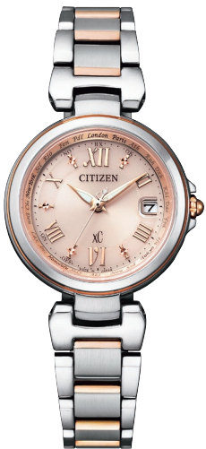
EC1034-59W ¥71,500 (税抜価格¥65,000)

Cal. H240／H246 ケース:ステンレス デュラテクトプラチナ(一部めっき) (ライトシルバー色・ピンクゴールド色) 厚み:7.4mm／横幅:27.8mm ガラス:サファイアガラス(無反射コーティング) 防水性能:5気圧防水 耐磁1種／夜光