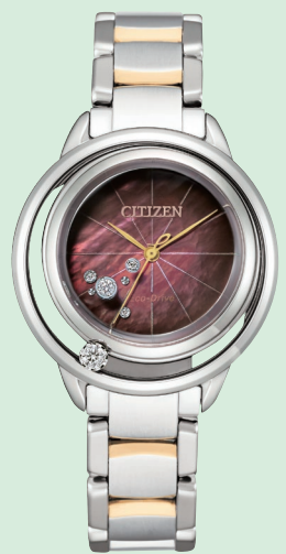
EW5529-55W ¥110,000 (税抜価格¥100,000)

ケース:ステンレス 厚み:8.3mm/横幅:32.5mm ガラス:球面サファイアガラス 防水性能:5気圧防水 白蝶貝文字板 文字板:2ポイントダイヤ入 ガラス:2ポイントダイヤ入 ケース:1ポイントダイヤ入