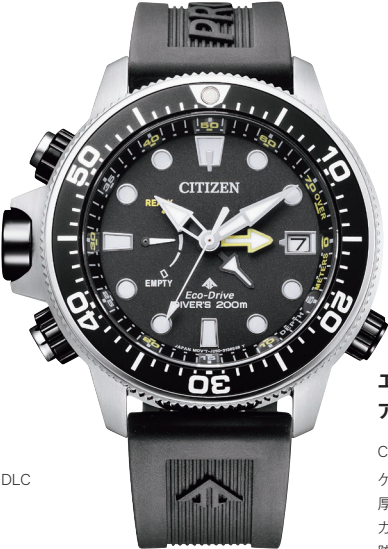
BN2036-14E ¥82,500 (税抜価格¥75,000)

Cal. F158 ケース:スーパーチタニウム デュラテクトDLC・デュラテクトMRK+DLC (ブラック色) 厚み:15.6mm／横幅:47.0mm ガラス:サファイアガラス 防水性能:200m潜水用防水 ISO 耐磁1種／夜光 逆回転防止ベゼル／ねじロックリゅうず ウレタンバンド／延長バンド付