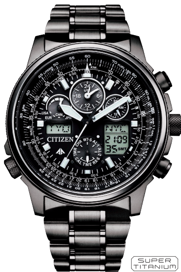
JY8025-59E ¥143,000 (税抜価格¥130,000)

Cal. E660 ケース:ステンレス めっき(ジェットブラック色・ブルー色) 厚み:13.7mm/横幅:45.9mm ガラス:サファイアガラス(無反射コーティング) 防水性能:20気圧防水 夜光/航空計算尺 ウレタンバンド