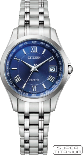
EC1120-59L ¥143,000 (税抜価格¥130,000)

Cal. H149 ケース:スーパーチタニウム デュラテクトブラチナ・デュラテクトピンク (ライトシルバー色・ピンクゴールド色) 厚み:8.5mm/横幅:38.0mm ガラス:サファイアガラス (クラリティ・コーティング) 防水性能:5気圧防水 耐ニッケル/耐磁1種