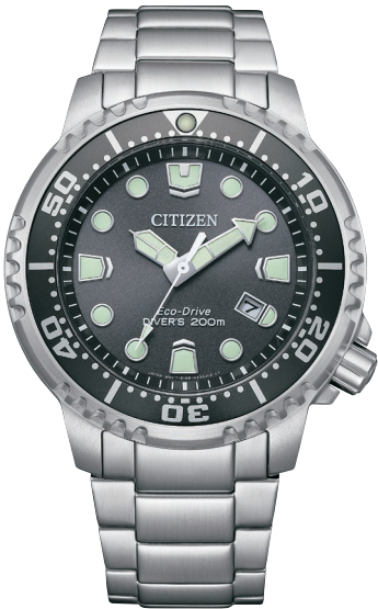
NEW 6月発売 BN0167-50H ¥49,500 (税抜価格¥45,000)

Cal. E168 ケース:ステンレス 厚み:11.5mm／横幅:44.0mm ガラス:クリスタルガラス 防水性能:200m潜水用防水 ISO 耐磁1種／夜光 逆回転防止ベゼル／ねじロックりゅうず ラチェット付ダブルホールディングバックル