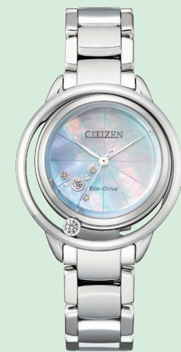
EW5521-81D ¥110,000 (税抜価格¥100,000)

ケース:ステンレス めっき(ウォームゴールド色) 厚み:8.3mm/横幅:29.5mm ガラス:球面サファイアガラス 防水性能:5気圧防水 白蝶貝文字板 文字板部品:一部再生素材 文字板:1ポイントダイヤ入 ケース:4ポイントダイヤ入 りゅうず:ガラスセラミックス (ブルー色)入