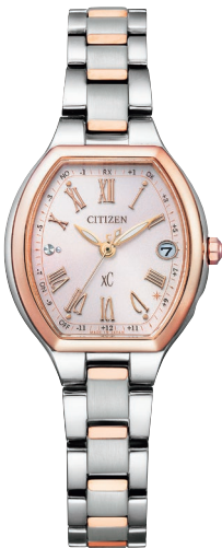
ES9364-57W ¥72,600 (税抜価格¥66,000)

Cal. H246 ケース:ステンレス めっき(サクラ色) 厚み:7.4mm／横幅:27.8mm ガラス:サファイアガラス(無反射コーティング) 防水性能:5気圧防水 耐磁1種／夜光