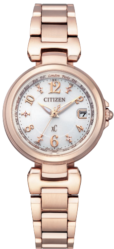
EC1037-51A ¥71,500 (税抜価格¥65,000)

Cal. H240／H246 ケース:ステンレス デュラテクトプラチナ(一部めっき) (ライトシルバー色・ピンクゴールド色) 厚み:7.4mm／横幅:27.8mm ガラス:サファイアガラス(無反射コーティング) 防水性能:5気圧防水 耐磁1種／夜光