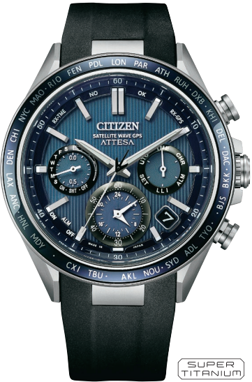
CC4050-18L ¥253,000 (税抜価格¥230,000)