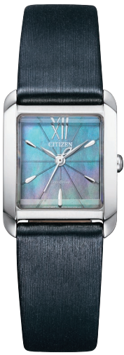
EW5557-17N ¥33,000 (税抜価格¥30,000)

Cal. B035 ケース:ステンレス 一部めっき(ウォームゴールド色) 厚み:7.5mm／横幅:21.5mm ガラス:カーブカットサファイアガラス 防水性能:5気圧防水 白蝶貝文字板