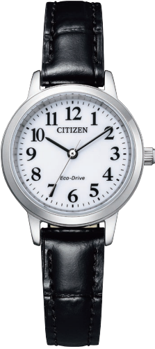
EM0930-15A ¥18,700 (税抜価格¥17,000)

Cal. E031 ケース:ステンレス 厚み:8.8mm／横幅:38.0mm ガラス:クリスタルガラス 防水性能:10気圧防水 カーフ革バンド