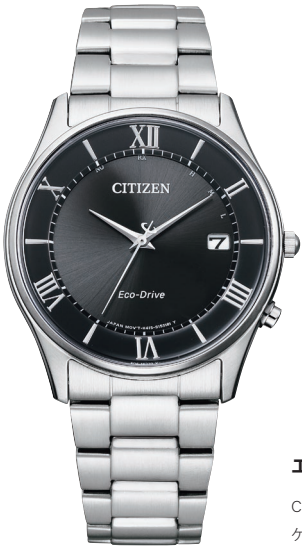
AS1060-54E ¥44,000 (税抜価格¥40,000)

Cal. H415 ケース:ステンレス 厚み:8.4mm／横幅:37.2mm ガラス:サファイアガラス 防水性能:5気圧防水 耐磁1種 シンプルアジャスト