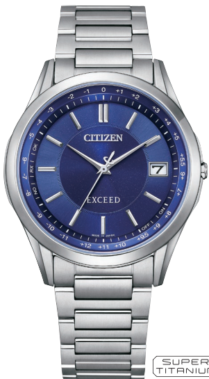
NEW 7月発売予定 CB1110-61L ¥121,000 (税抜価格¥110,000)

Cal. H149 ケース:スーパーチタニウム デュラテクトブラチナ(ライトシルバー色) 厚み:8.5mm/横幅:38.0mm ガラス:サファイアガラス (クラリティ・コーティング) 防水性能:5気圧防水 耐ニッケル/耐磁1種