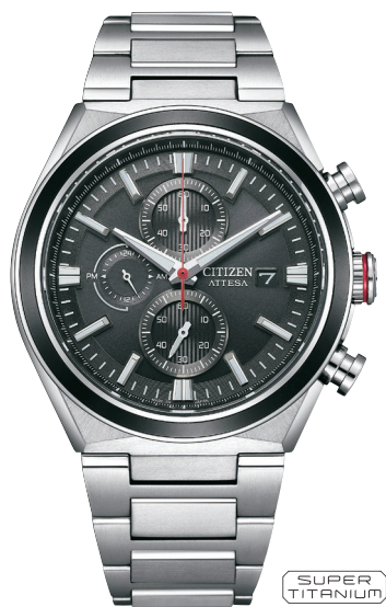
CA0836-68E ¥82,500 (税抜価格¥75,000)

Cal. B612 ケース:スーパーチタニウム デュラテクトチタンカーバイト(シルバー色) ベゼル:上面アルミニウムリング(ブラック色) 厚み:11.6mm/横幅:42.0mm ガラス:サファイアガラス(無反射コーティング) 防水性能:10気圧防水 耐メタル/夜光/フィットアジャスター