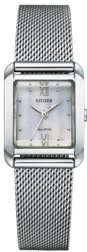
替えバンド イメージ

Cal. E031 ケース:ステンレス めっき(ウォームゴールド色) 厚み:8.0mm／横幅:28.0mm ガラス:球面サファイアガラス 防水性能:5気圧防水 白蝶貝文字板