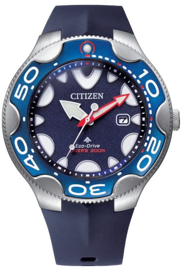
NEW 5月発売 BN0231-01L ¥66,000 (税抜価格¥60,000)

Cal. E168 ケース:ステンレス 厚み:14.6mm／横幅:46.0mm ガラス:球面クリスタルガラス 防水性能:200m潜水用防水 ISO 耐磁1種／夜光 逆回転防止ベゼル／ねじロックリゅうず ウレタンバンド