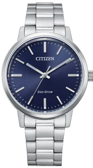
BJ6541-58L ¥22,000 (税抜価格¥20,000)

Cal. E031 ケース:ステンレス 厚み:7.5mm／横幅:27.0mm ガラス:クリスタルガラス 防水性能:5気圧防水 カーフ革バンド