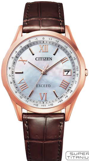
CB1112-07W ¥121,000 (税抜価格¥110,000)

Cal. H060 ケース:スーパーチタニウム デュラテクトブラチナ(ライトシルバー色) 厚み:7.7mm/横幅:26.6mm ガラス:サファイアガラス (クラリティ・コーティング) 防水性能:5気圧防水 耐ニッケル/耐磁1種