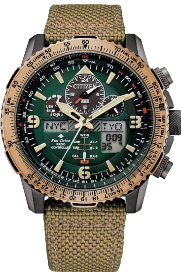
JY8074-11X ¥84,700 (税抜価格¥77,000)

Cal. U680 ケース:スーパーチタニウム デュラテクトMRK(シルバー色) 厚み:13.9mm/横幅:43.7mm ガラス:サファイアガラス(無反射コーティング) 防水性能:20気圧防水 耐ニッケル/耐磁1種/夜光/航空計算尺 フィットアジャスター