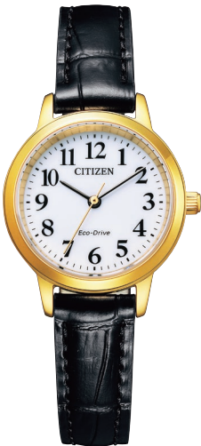
EM0932-10A ¥18,700 (税抜価格¥17,000)

Cal. E031 ケース:ステンレス めっき(イエローゴールド色) 厚み:8.8mm／横幅:38.0mm ガラス:クリスタルガラス 防水性能:10気圧防水 カーフ革バンド