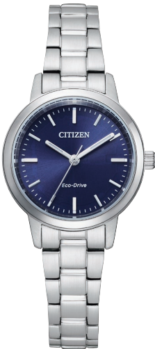
EM0930-58L ¥22,000 (税抜価格¥20,000)

Cal. E031 ケース:ステンレス 厚み:8.8mm／横幅:38.0mm ガラス:クリスタルガラス 防水性能:10気圧防水 夜光