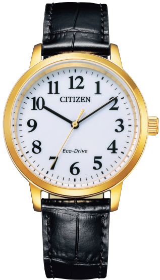
BJ6543-10A ¥18,700 (税抜価格¥17,000)

Cal. E031 ケース:ステンレス 一部めっき(ピンクゴールド色) 厚み:7.1mm／横幅:27.7mm ガラス:サファイアガラス 防水性能:5気圧防水 シンプルアジャスト