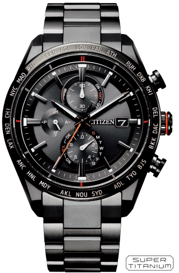
AT8185-62E ¥159,500 (税抜価格¥145,000)

Cal. F950 ケース:スーパーチタニウム デュラテクトピンク・デュラテクトDLC (ピンクゴールド色・ブラック色) 厚み:15.4mm/横幅:44.3mm ガラス:デュアル球面サファイアガラス (クラリティ・コーティング) 防水性能:10気圧防水 耐ニッケル/耐磁1種/夜光 フィットアジャスター