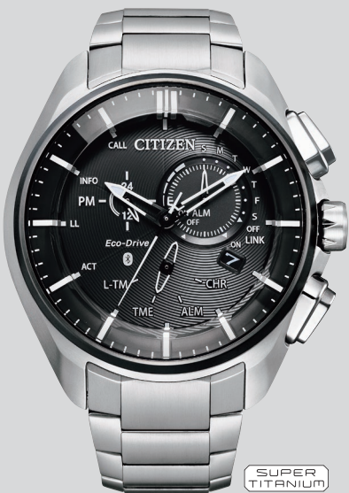
BZ1041-57E ¥115,500 (税抜価格¥105,000)