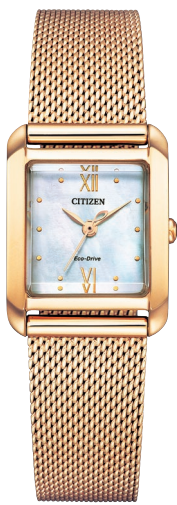
替えバンド イメージ

Cal. B035 ケース:ステンレス 厚み:7.5mm／横幅:21.5mm ガラス:カーブカットサファイアガラス 防水性能:5気圧防水 替えバンド合成皮革(ECOPET®)付