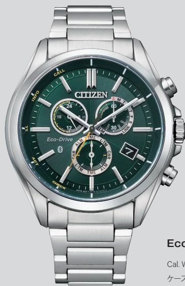
BZ1050-56W ¥70,400 (税抜価格¥64,000)