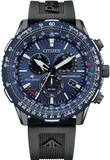
CB5006-02L ¥77,000 (税抜価格¥70,000)

Cal. E660 ケース:ステンレス 一部めっき(グリーン色) 厚み:13.7mm/横幅:45.9mm ガラス:サファイアガラス(無反射コーティング) 防水性能:20気圧防水 夜光/航空計算尺