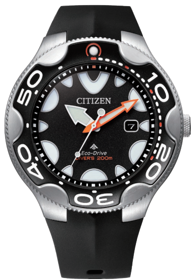
NEW 5月発売 BN0230-04E ¥66,000 (税抜価格¥60,000)

Cal. E168 ケース:ステンレス 厚み:14.6mm／横幅:46.0mm ガラス:球面クリスタルガラス 防水性能:200m潜水用防水 ISO 耐磁1種／夜光 逆回転防止ベゼル／ねじロックリゅうず ウレタンバンド