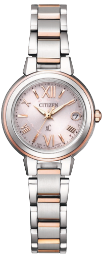
ES9434-53W ¥62,700 (税抜価格¥57,000)

Cal. H060 ケース:ステンレス デュラテクトプラチナ(ライトシルバー色) 厚み:7.2mm／横幅:25.0mm ガラス:サファイアガラス(無反射コーティング) 防水性能:10気圧防水 耐磁1種／夜光