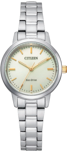
EM0930-58P ¥22,000 (税抜価格¥20,000)

Cal. E031 ケース:ステンレス 厚み:8.8mm／横幅:38.0mm ガラス:クリスタルガラス 防水性能:10気圧防水 夜光