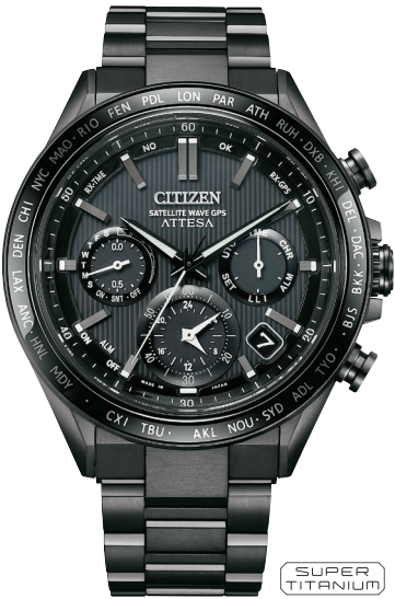
CC4055-65E ¥308,000 (税抜価格¥280,000)