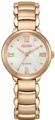
NEW 7月発売予定 EM0929-81Y ¥37,400 (税抜価格¥34,000)

Cal. E031 ケース:ステンレス めっき(ピンクゴールド色) 厚み:8.0mm／横幅:28.0mm ガラス:球面サファイアガラス 防水性能:5気圧防水 白蝶貝文字板