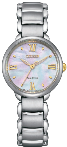
NEW 7月発売予定 EM0927-87Y ¥33,000 (税抜価格¥30,000)

Cal. E031 ケース:ステンレス 厚み:8.0mm／横幅:28.0mm ガラス:球面サファイアガラス 防水性能:5気圧防水 白蝶貝文字板