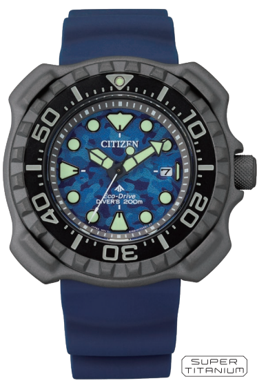
BN0227-09L ¥66,000 (税抜価格¥60,000)

Cal. E168 ケース:スーパーチタニウム デュラテクトDLC・デュラテクトMRK+DLC (ブラック色) 厚み:14.3mm／横幅:45.8mm ガラス:クリスタルガラス 防水性能:200m潜水用防水 ISO 耐磁1種／夜光 逆回転防止ベゼル／ねじロックりゅうず ウレタンバンド／延長バンド付