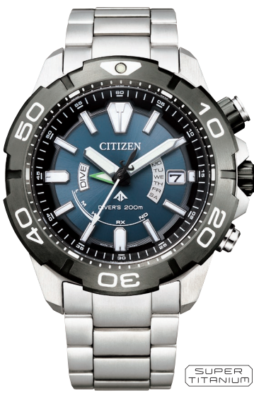
AS7145-69L ¥138,600 (税抜価格¥126,000)

Cal. E168 ケース:ステンレス 厚み:11.5mm／横幅:44.0mm ガラス:クリスタルガラス (無反射コーティング) 防水性能:200m潜水用防水 ISO 耐磁1種／夜光 逆回転防止ベゼル／ねじロックりゅうず ウレタンバンド