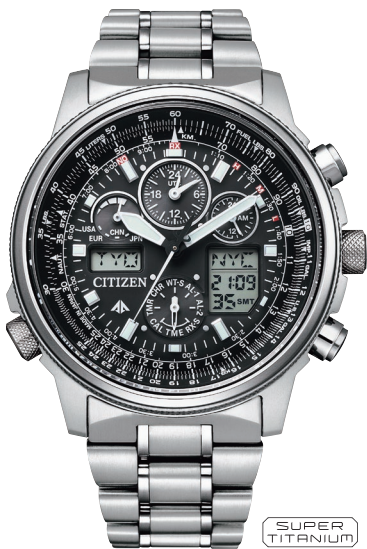
PMV65-2271 ¥110,000 (税抜価格¥100,000)

Cal. U680 ケース:スーパーチタニウム デュラテクトMRK+DLC(ブラック色) 厚み:13.9mm/横幅:43.7mm ガラス:サファイアガラス(無反射コーティング) 防水性能:20気圧防水 耐ニッケル/耐磁1種/夜光/航空計算尺 フィットアジャスター