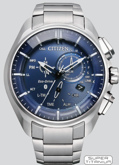
BZ1040-50L ¥110,000 (税抜価格¥100,000)