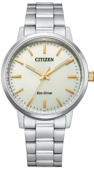
BJ6541-58P ¥22,000 (税抜価格¥20,000)

Cal. E031 ケース:ステンレス 厚み:7.5mm／横幅:27.0mm ガラス:クリスタルガラス 防水性能:5気圧防水 夜光