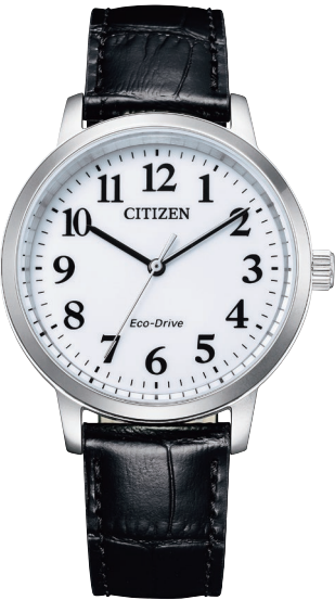
BJ6541-15A ¥18,700 (税抜価格¥17,000)

Cal. E031 ケース:ステンレス めっき(イエローゴールド色) 厚み:7.5mm／横幅:27.0mm ガラス:クリスタルガラス 防水性能:5気圧防水 カーフ革バンド