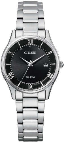
ES0000-79E ¥44,000 (税抜価格¥40,000)

Cal. H415 ケース:ステンレス 厚み:8.4mm／横幅:37.2mm ガラス:サファイアガラス 防水性能:5気圧防水 耐磁1種 シンプルアジャスト