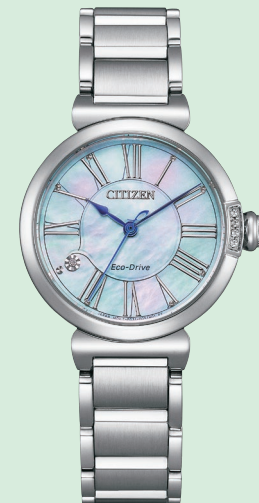
EM1060-87N ¥50,600 (税抜価格¥46,000)