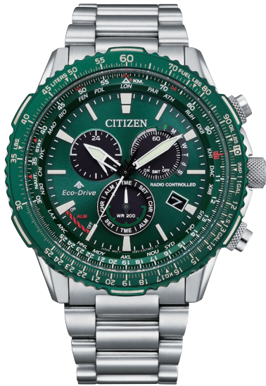
CB5004-59W ¥82,500 (税抜価格¥75,000)

Cal. E660 ケース:ステンレス めっき(グレー色・ワインレッド色) 厚み:13.7mm/横幅:45.9mm ガラス:サファイアガラス(無反射コーティング) 防水性能:20気圧防水 夜光/航空計算尺