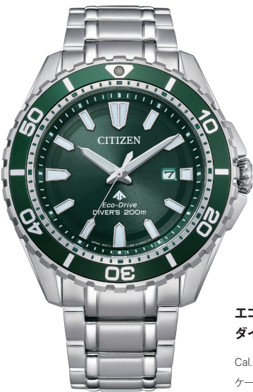
BN0199-53X ¥49,500 (税抜価格¥45,000)

Cal. J250 ケース:ステンレス 厚み:16.4mm／横幅:46.1mm ガラス:クリスタルガラス 防水性能:200m潜水用防水 ISO 耐磁1種／夜光 逆回転防止ベゼル ねじロックリゅうず／ねじロックボタン ウレタンバンド／延長バンド付