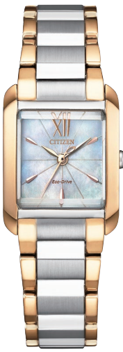
EW5559-89D ¥38,500 (税抜価格¥35,000)

Cal. B035 ケース:ステンレス 一部めっき(ウォームゴールド色) 厚み:7.5mm／横幅:21.5mm ガラス:カーブカットサファイアガラス 防水性能:5気圧防水 白蝶貝文字板