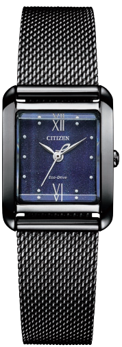
替えバンド イメージ

Cal. B035 ケース:ステンレス めっき(ウォームゴールド色) 厚み:7.5mm／横幅:21.5mm ガラス:カーブカットサファイアガラス 防水性能:5気圧防水 白蝶貝文字板／替えバンド合成皮革(ECOPET®)付