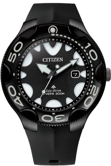
NEW 5月発売 BN0235-01E ¥66,000 (税抜価格¥60,000)

Cal. E168 ケース:ステンレス 厚み:14.6mm／横幅:46.0mm ガラス:球面クリスタルガラス 防水性能:200m潜水用防水 ISO 耐磁1種／夜光 逆回転防止ベゼル／ねじロックリゅうず ウレタンバンド