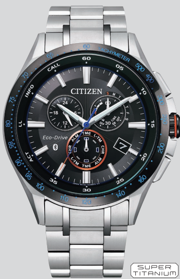
BZ1034-52E ¥110,000 (税抜価格¥100,000)