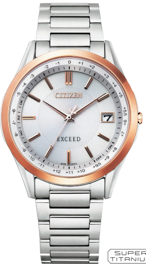
CB1114-52A ¥121,000 (税抜価格¥110,000)