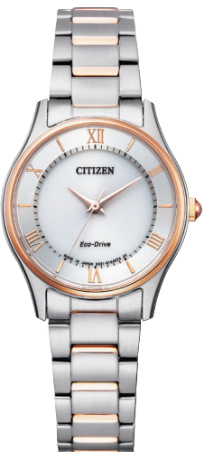
EM0404-51A ¥35,200 (税抜価格¥32,000)

Cal. E031 ケース:ステンレス 一部めっき(ピンクゴールド色) 厚み:7.1mm／横幅:37.2mm ガラス:サファイアガラス 防水性能:5気圧防水 シンプルアジャスト