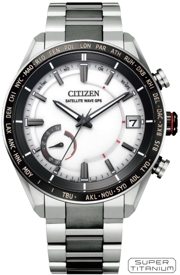
CC3085-51A ¥203,500 (税抜価格¥185,000)