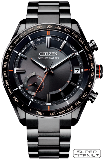
CC3085-51E ¥220,000 (税抜価格¥200,000)