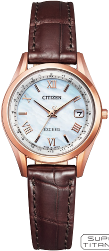
ES9372-08W ¥121,000 (税抜価格¥110,000)

Cal. H149 ケース:スーパーチタニウム デュラテクトピンク(ピンクゴールド色) 厚み:8.5mm/横幅:38.0mm ガラス:サファイアガラス(クラリティ・コーティング) 防水性能:5気圧防水 耐磁1種/白蝶貝文字板 ワニ革バンド