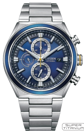
CA0837-65L ¥82,500 (税抜価格¥75,000)

Cal. B612 ケース:スーパーチタニウム デュラテクトチタンカーバイト(シルバー色) ベゼル:上面アルミニウムリング(ブラック色) 厚み:11.6mm/横幅:42.0mm ガラス:サファイアガラス(無反射コーティング) 防水性能:10気圧防水 耐メタル/夜光/フィットアジャスター