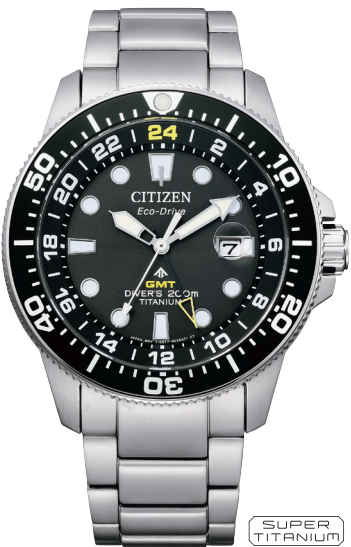
BJ7110-89E ¥72,600 (税抜価格¥66,000)

Cal. B877 ケース:スーパーチタニウム デュラテクトチタンカーバイド[一部除く] (シルバー色) 厚み:13.8mm／横幅:43.0mm ガラス:サファイアガラス 防水性能:200m潜水用防水 ISO 耐ニッケル／耐磁1種／夜光 逆回転防止ベゼル／ねじロックりゅうず