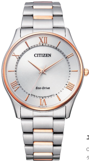
BJ6484-50A ¥35,200 (税抜価格¥32,000)

Cal. H0F0／H0F6 ケース:ステンレス 厚み:7.4mm／横幅:28.0mm ガラス:サファイアガラス 防水性能:5気圧防水 耐磁1種 シンプルアジャスト