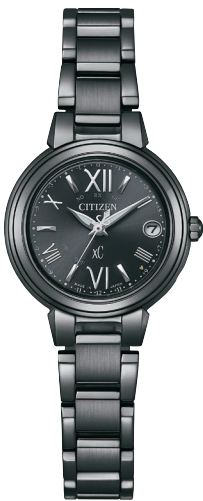
NEW 8月発売予定 限定モデル 1,000本 ES9435-69E ¥71,500 (税抜価格¥65,000)

Cal. H060 ケース:ステンレス デュラテクトプラチナ(一部めっき) (ライトシルバー色・ピンクゴールド色) 厚み:7.2mm／横幅:24.9mm ガラス:サファイアガラス(無反射コーティング) 防水性能:5気圧防水 耐磁1種／夜光 シンプルアジャスト