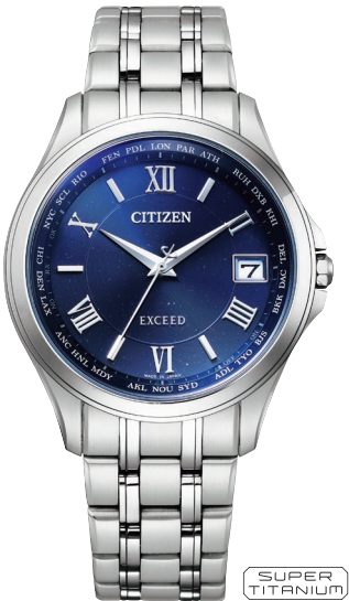
CB1080-52L ¥143,000 (税抜価格¥130,000)