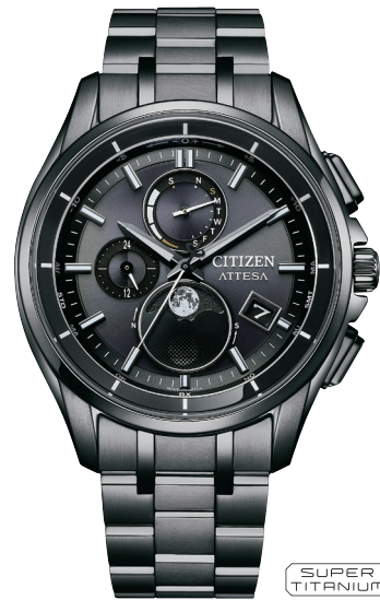
NEW 7月発売予定 BY1006-62E ¥170,500 (税抜価格¥155,000)

Cal. B612 ケース:スーパーチタニウム デュラテクトチタンカーバイト(シルバー色) ベゼル:上面アルミニウムリング(ブルー色) 厚み:11.6mm/横幅:42.0mm ガラス:サファイアガラス(無反射コーティング) 防水性能:10気圧防水 耐メタル/夜光/フィットアジャスター