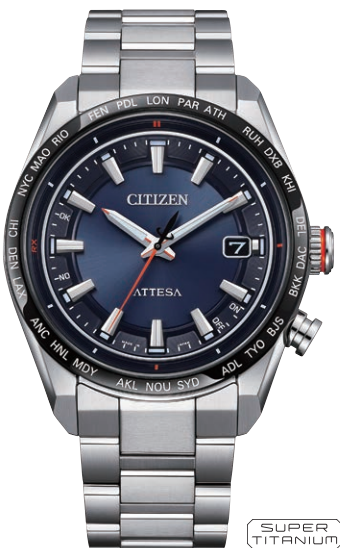
CB0287-68L ¥143,000(税抜価格¥130,000) ACT Line

エコ・ドライブ電波時計 ダイレクトフライト Cal. H145 ケース:スーパーチタニウム デュラテクトDLC(ブラック色) 厚み:10.6mm/横幅:40.6mm ガラス:サファイアガラス (無反射コーティング) 防水性能:10気圧防水 耐メタル/耐磁1種/夜光 フィットアジャスター