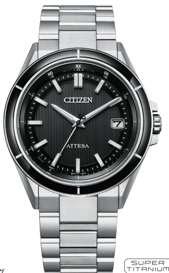
CB3030-76E ¥148,500(税抜価格¥135,000) ACT Line

エコ・ドライブ電波時計 ダイレクトフライト Cal. H128 ケース:スーパーチタニウム デュラテクトDLC(ブラック色) ベゼル:上面サファイアガラスリング 厚み:9.7mm/横幅:39.5mm ガラス:サファイアガラス (無反射コーティング) 防水性能:10気圧防水 耐メタル/耐磁1種/夜光 フィットアジャスター