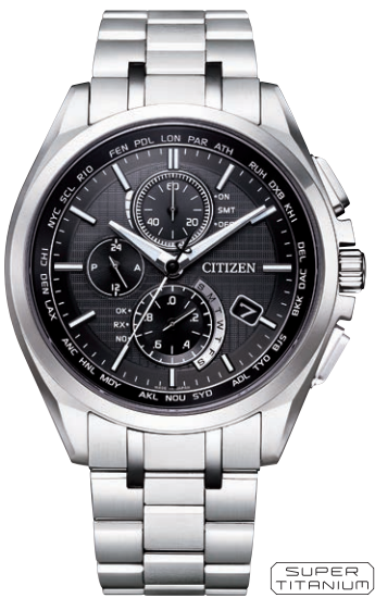
AT8040-57E ¥132,000(税抜価格¥120,000) Regular Line

エコ・ドライブ電波時計 ダイレクトフライト Cal. H804 ケース：スーパーチタニウム デュラテクトDLC (ブラック色) 厚み：9.7mm／横幅：41.5mm ガラス：サファイアガラス (クラリティ・コーティング) 防水性能：10気圧防水 耐ニッケル／耐磁1種／夜光 フィットアジャスター