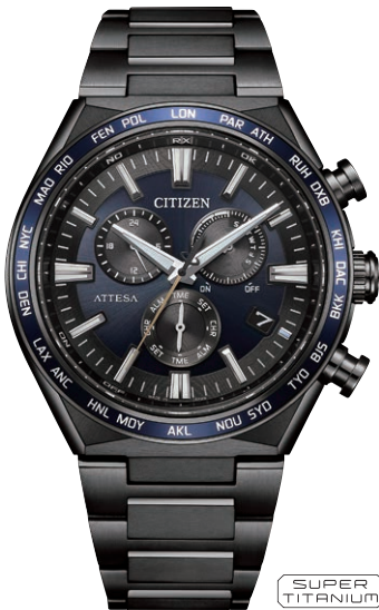
CB5967-66L ¥126,500(税抜価格¥115,000) Black Titanium™ Series ACT Line

エコ・ドライブ電波時計 ダイレクトフライト Cal. H128 ケース:スーパーチタニウム デュラテクトチタンカーバイド (シルバー色) ベゼル:上面サファイアガラスリング 厚み:9.7mm/横幅:39.5mm ガラス:サファイアガラス (無反射コーティング) 防水性能:10気圧防水 耐メタル/耐磁1種/夜光 フィットアジャスター