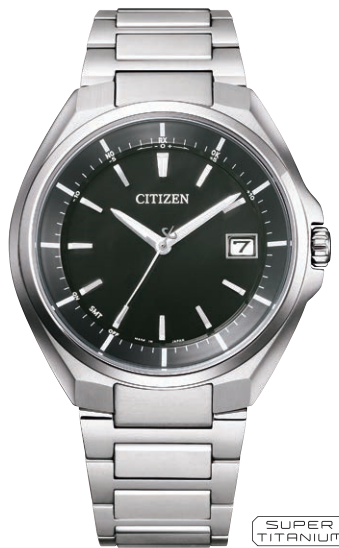
CB3010-57E ¥82,500(税抜価格¥75,000) Regular Line

エコ・ドライブ電波時計 ダイレクトフライト Cal. H128 ケース:スーパーチタニウム デュラテクトDLC(ブラック色) 厚み:9.3mm/横幅:40.0mm ガラス:サファイアガラス (無反射コーティング) 防水性能:10気圧防水 耐ニッケル/耐磁1種/夜光 フィットアジャスター