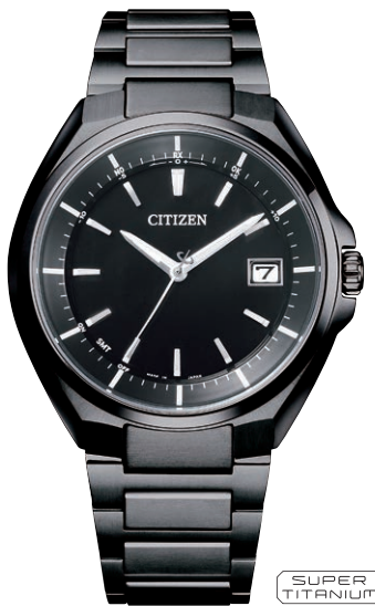
CB3015-53E ¥110,000(税抜価格¥100,000) Black Titanium™ Series Regular Line

エコ・ドライブ電波時計 ダイレクトフライト Cal. E660 ケース:スーパーチタニウム デュラテクトチタンカーバイド (シルバー色) 厚み:12.5mm/横幅:41.1mm ガラス:サファイアガラス (無反射コーティング) 防水性能:10気圧防水 耐メタル/夜光 フィットアジャスター