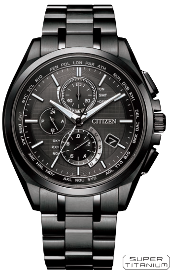
AT8044-56E ¥176,000(税抜価格¥160,000) Black Titanium™ Series Regular Line

エコ・ドライブ電波時計 ダイレクトフライト Cal. H874 ケース：スーパーチタニウム デュラテクトチタンカーバイド・ デュラテクトピンク (シルバー色・ピンクゴールド色) 厚み：10.8mm／横幅：41.5mm ガラス：サファイアガラス (無反射コーティング) 防水性能：10気圧防水 耐磁1種／夜光 カーフ革バンド ムーンフェイズ機能 月齢自動計算機能