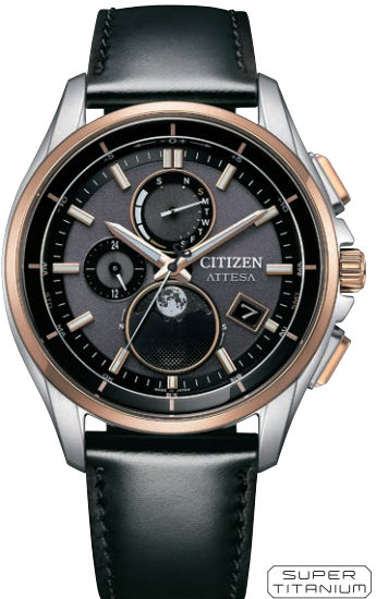
BY1004-17X ¥137,500(税抜価格¥125,000) Regular Line

エコ・ドライブ電波時計 ダイレクトフライト Cal. H874 ケース：スーパーチタニウム デュラテクトチタンカーバイド (シルバー色) 厚み：10.8mm／横幅：41.5mm ガラス：サファイアガラス (無反射コーティング) 防水性能：10気圧防水 耐メタル／耐磁1種／夜光 フィットアジャスター ムーンフェイズ機能 月齢自動計算機能