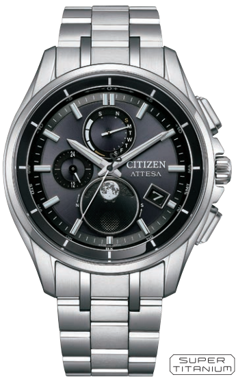
BY1001-66E ¥148,500(税抜価格¥135,000) Regular Line

エコ・ドライブ電波時計 ダイレクトフライト Cal. H874 ケース：スーパーチタニウム デュラテクトDLC(ブラック色) 厚み：10.8mm／横幅：41.5mm ガラス：サファイアガラス (無反射コーティング) 防水性能：10気圧防水 耐メタル／耐磁1種／夜光 フィットアジャスター ムーンフェイズ機能 月齢自動計算機能