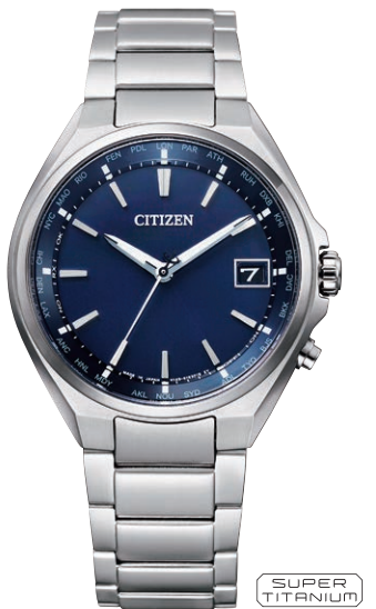
CB1120-50L ¥66,000(税抜価格¥60,000) Regular Line

エコ・ドライブ電波時計 ダイレクトフライト Cal. H128 ケース:スーパーチタニウム デュラテクトチタンカーバイド (シルバー色) 厚み:9.3mm/横幅:40.0mm ガラス:サファイアガラス (無反射コーティング) 防水性能:10気圧防水 耐ニッケル/耐磁1種/夜光 フィットアジャスター