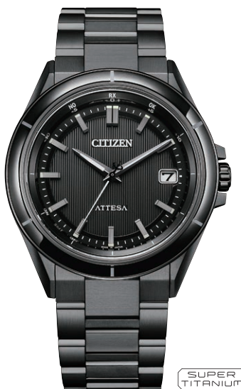
CB3035-72E ¥187,000(税抜価格¥170,000) Black Titanium™ Series ACT Line

エコ・ドライブ電波時計 ダイレクトフライト Cal. H145 ケース:スーパーチタニウム デュラテクトチタンカーバイド・ デュラテクトDLC (シルバー色・ブラック色) 厚み:10.6mm/横幅:40.6mm ガラス:サファイアガラス (無反射コーティング) 防水性能:10気圧防水 耐メタル/耐磁1種/夜光 フィットアジャスター