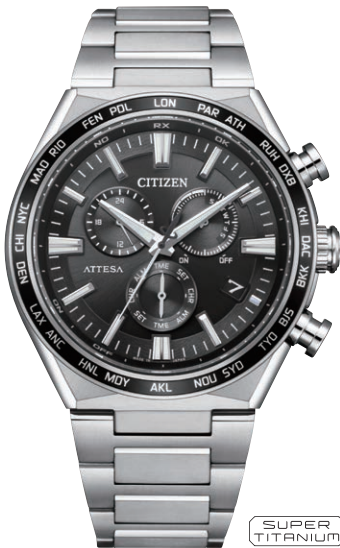
CB5966-69E ¥99,000(税抜価格¥90,000) ACT Line

エコ・ドライブ電波時計 ダイレクトフライト Cal. E660 ケース:スーパーチタニウム デュラテクトDLC(ブラック色) 厚み:12.5mm/横幅:41.1mm ガラス:サファイアガラス (無反射コーティング) 防水性能:10気圧防水 耐メタル/夜光 フィットアジャスター