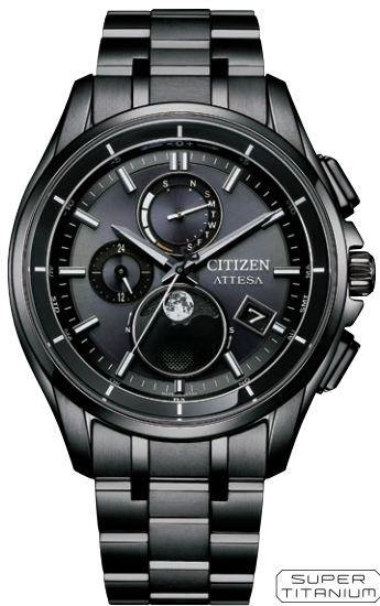
BY1006-62E ¥187,000(税抜価格¥170,000) Black Titanium™ Series Regular Line

エコ・ドライブ電波時計 ダイレクトフライト Cal. H874 ケース：スーパーチタニウム デュラテクトDLC(ブラック色) 厚み：10.8mm／横幅：41.5mm ガラス：サファイアガラス (無反射コーティング) 防水性能：10気圧防水 耐メタル／耐磁1種／夜光 フィットアジャスター ムーンフェイズ機能 月齢自動計算機能