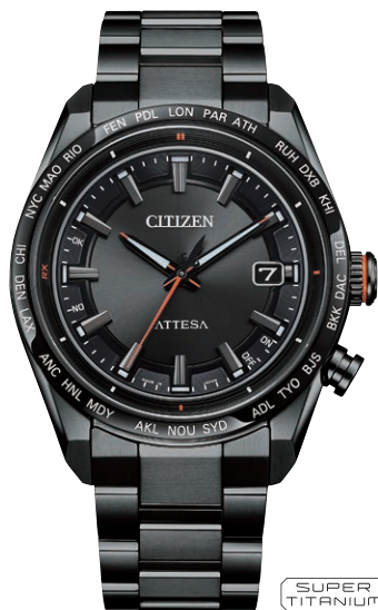
CB0286-61E ¥159,500(税抜価格¥145,000) Black Titanium™ Series ACT Line

エコ・ドライブ電波時計 ダイレクトフライト Cal. H145 ケース:スーパーチタニウム デュラテクトDLC(ブラック色) 厚み:10.6mm/横幅:40.6mm ガラス:サファイアガラス (無反射コーティング) 防水性能:10気圧防水 耐メタル/耐磁1種/夜光 フィットアジャスター